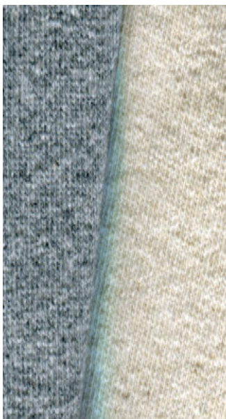
felpa non garzata