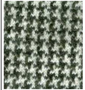
piep-poul in lana